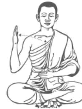
๙. เคลื่อนมือขวาออก รู้สึกร้าว และหยุด