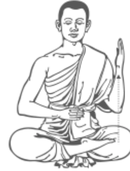
๖. ยกมือซ้ายขึ้น รู้สึกร้าว และหยุด