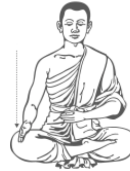
๑๐. ลดมือขวาลงไว้ที่หัวเข่า รู้สึกร้าว และหยุด