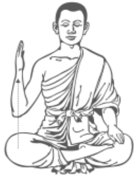
๓. ยกมือขวาขึ้น รู้สึกร้าว และหยุด