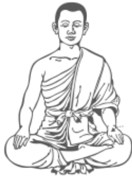
๑๕. คว่ำมือซ้ายลง รู้สึกรู้ตัว และหยุด และทำการ เคลื่อนไหวตั้งแต่เริ่มต้นจนอีก ให้ต่อเนื่องกันไป