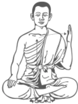
๑๓. เคลื่อนมือซ้ายออก รู้สึกรู้ตัว และหยุด