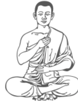
๘. เคลื่อนมือขวาขึ้นมาที่หน้าอก รู้สึกร้าว และหยุด