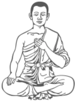
๑๒. เคลื่อนมือซ้ายขึ้นมาที่หน้าอก รู้สึกรู้ตัว และหยุด