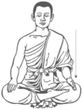
๑๔. ลดมือซ้ายลงที่หัวเข่า รู้สึกรู้ตัว และหยุด