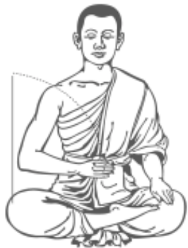
๔. ลดมือขวามาไว้ที่สะดือ รู้สึกร้าว และหยุด