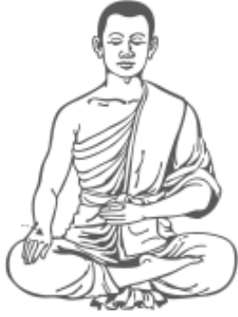
๑๑. คว่ำมือขวาลง รู้สึกรู้ตัว และหยุด