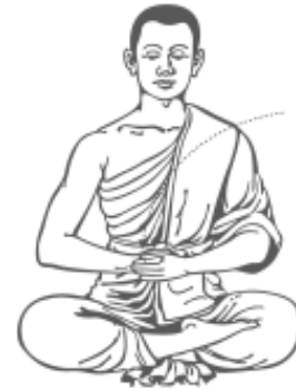
๗. ลดมือซ้ายมาไว้ที่สะดือ รู้สึกร้าว และหยุด