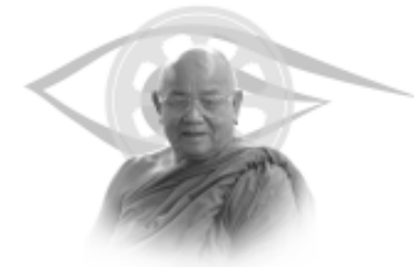
ประวัติ หลวงพ่อกำเขียน สุวณฺโณ